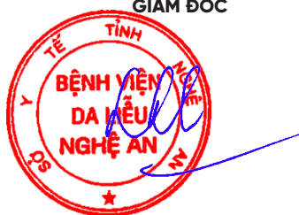
BSCKII. Huỳnh Phúc Sơn